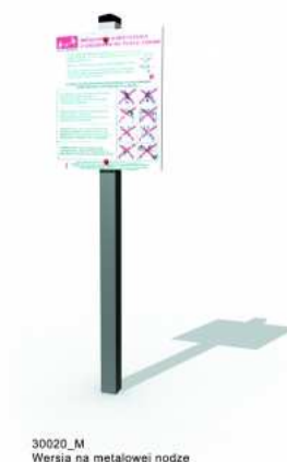
30020_M Wersja na metalowej nodze